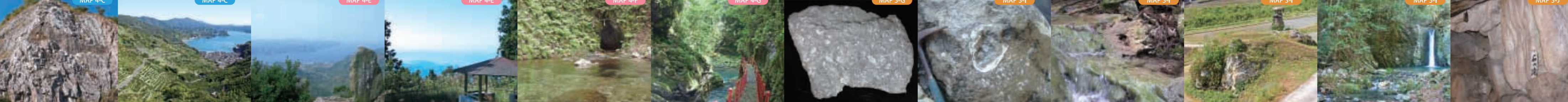
13 大早津の石灰岩 (MAP 4-C) | 14 狩浜のだん畑 (MAP 4-C) | 15 法華津峠 (MAP 4-E) | 16 高森山 (MAP 4-E) | 17 観音水 (MAP 4-F) | 18 桂川渓谷 (MAP 4-G) | 19 田穂の石灰岩 (MAP 3-G) | 20 下相のジュラ紀化石産地 (MAP 3-I) | 21 中津川のトッフア (MAP 3-I) | 22 岩上田 (MAP 3-I) | 23 三滝溪谷 (MAP 3-I) | 24 穴神鍾乳洞 (MAP 3-J)